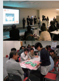
昨年プロジェクトの様子

※希望する企業名とその理由を記載してください。 参加費用：無料 募集定員：40名